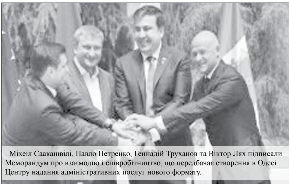
Міхеїл Саакашвілі, Павло Петренко, Геннадій Труханов та Віктор Лях підписали Меморандум про взаємодію і співробітництво, що передбачає створення в Одесі Центру надання адміністративних послуг нового формату.

У планах на майбутнє рішення питання про розвиток спортивної інфраструктури Одеси і, зокрема, організація