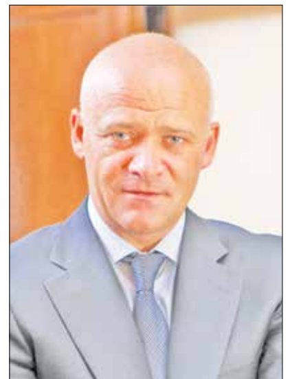
Одеський міський голова, Г.Л. Труханов