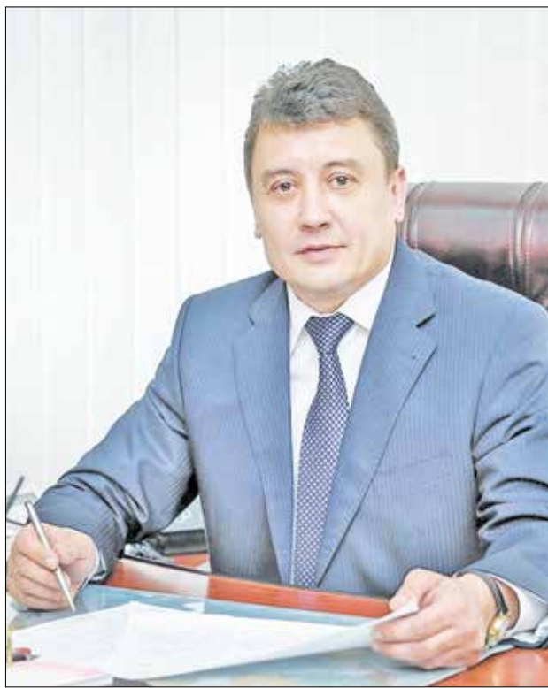
Гончаренко Володимир Олександрович, Начальник УДМС України в Кіровоградській області