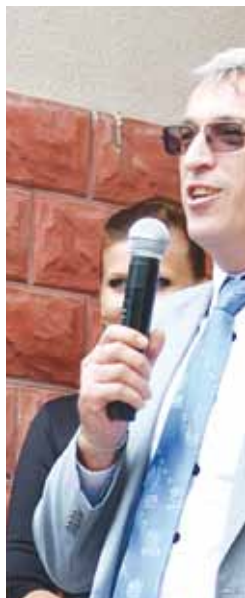
Регіональний представник у справах біженців та Україні Олдріх Андрисек у виступі що нагадує біженців у світі повідомив про новини 51,2 млн після Великої В

20 червня на території Пункту тимчасового розміщення біженців в Одесі відбулись заходи присвячені Всесвітньому дню біженців.