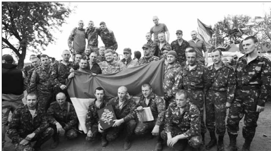
Робоча поїздка П.Порошенка на Донбас, 20 червня 2014 року

Президент України Петро Порошенко у ході першої робочої поїздки на Донбас представив мирний план з врегулювання ситуації в східних регіонах держави.