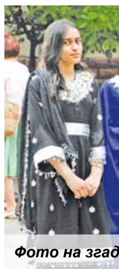
Фото на згадку