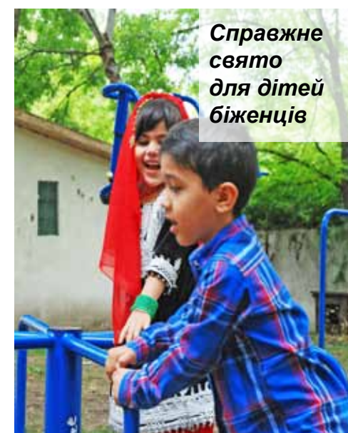
Справжнє свято для дітей біженців