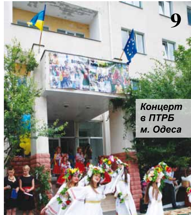
9 Концерт в ПТРБ м. Одеса