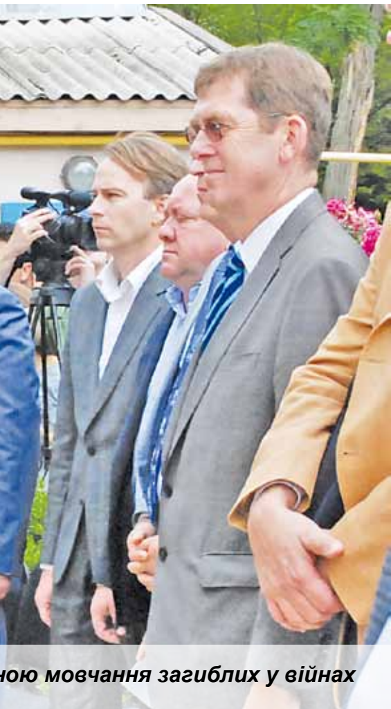
ною мовчання загиблих у війнах