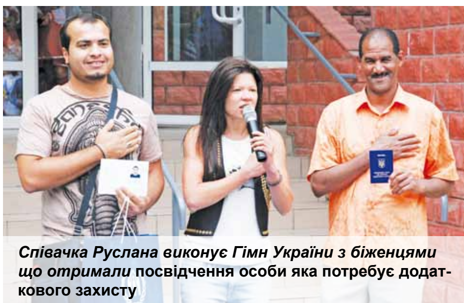
Співачка Руслана виконує Гімн України з біженцями що отримали посвідчення особи яка потребує додат- кового захисту