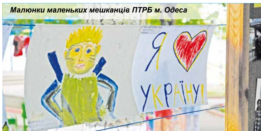
Малюнки маленьких мешканців ПТРБ м. Одеса