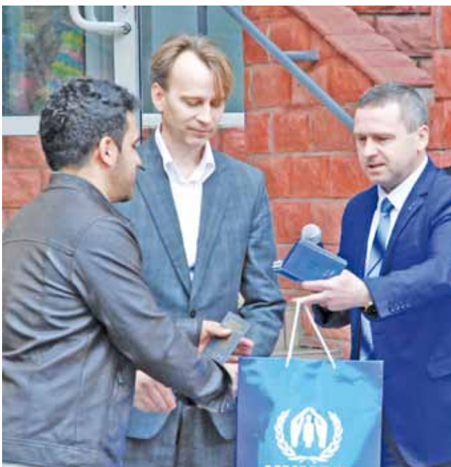
Перший заступник Голови Державної міграційної служби України Ю.В.Сергієнко та в.о. начальника ГУ ДМСУ в Одеській області В.В.Пасулько вручають посвідчення особи яка потребує додаткового захисту біженцям

20 червня у світі відзначають Всесвітній день біженців за резолюцією ООН від 4 грудня 2000 року.