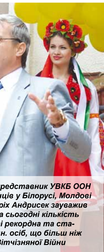
представник УВКБ ООН в Білорусі, Молдові в Бірюківській Андришівці зауважив на сьогоднішню кількість і рекордна та ста- н. осіб, що більш ніж вітчизняної Війни