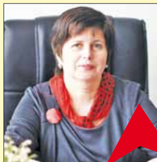
Заступник Голови ДМС України Тетяна Нікітіна:

Протягом останніх місяців Державна міграційна служба України зробила низку принципових кроків, спрямованих на спрощення та удосконалення процедур надання адміністративних послуг, проте багато роботи ще попереду.