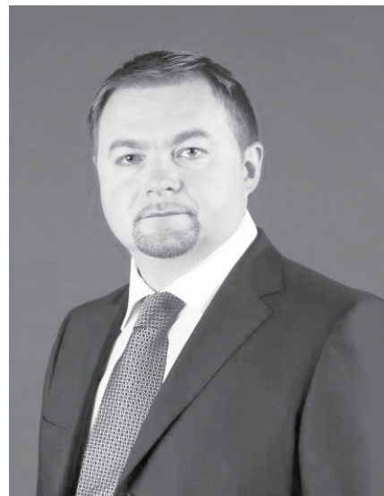
Ярослав КАШУБА, Голова Державної служби зайнятості (керівник Центрального апарату), доктор економічних наук

Станом на 20 березня 2015 року продовжували отримувати послуги служби зайнятості 20,5 тис. осіб, що отримали довідку про взяття їх на облік як осіб, які переміщуються з тимчасово окупованої території України або районів проведення АТО, з них 16,2 тис. осіб мали статус безробітного.