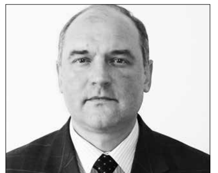
Начальник Управління ДМС України в Хмельницькій області Олег Паньков

Метою засідання стала співпраця органів місцевого самоврядування та органами виконавчої влади в умовах реформування та курсу держави на децентралізацію влади. Також учасниками засідання були обговоренні питання щодо основних принципів та особливостей нових законів у сфері місцевого самоврядування, зміни до податкового та бюджетного зако-