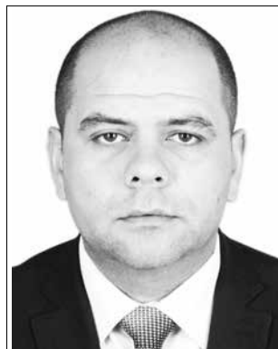
Начальник Управління ДМС України в Сумській області Дмитро Костенніков