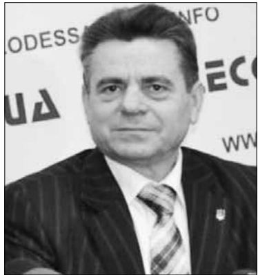
Заступник Начальника ГУ ДМС України в Одеській області Сергій Яворський

5 березня 2015 року в приміщенні медійного центру «Одеса-медіа» на прес-конференції для регіональних ЗМІ Одеського регіону, заступник начальника ГУ ДМСУ в Одеській області С.Х.Яворський розповів про процедуру прийому документів на оформлення паспорту громадянина України для виїзду за кордон з електронним носієм. У заході прийняли участь 10 телерадіокомпаній та 11 друкованих ЗМІ області.