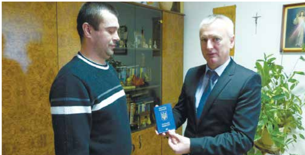
Ігор Володимирович Михайлишин Начальник ГУ ДМСУ у Закарпатській області