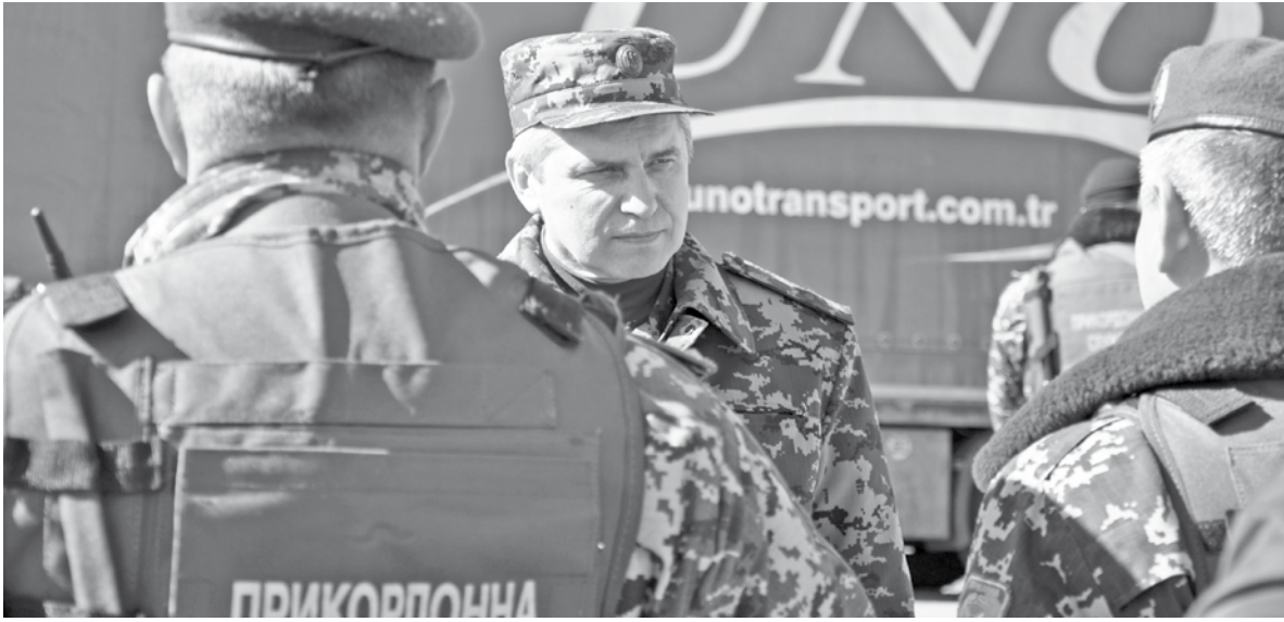
Голова Державної прикордонної служби України генерал армії України Микола Литвин перевіряє готовність підрозділів Східного регіонального управління та резервів до дій в екстремальних умовах і виконання інших завдань.

В рамках інспектування очільник відомства відвідав підрозділи Харківського, Донецького, Одеського прикордонних загонів, а також особисто оцінив обстановку на П лінії контролю в межах Херсонської, Миколаївської та Запорізької областей.