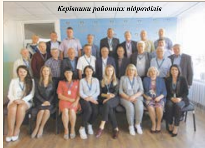
Керівники районних підрозділів

- «Забезпечення функціонування реєстру територіальних громад та дотримання вимог постанови Кабінету Міністрів України від 02.03.2016 р. № 207 «Про затвердження Правил реєстрації місця проживання та Порядку передачі органами реєстрації інформації до Єдиного державного де-