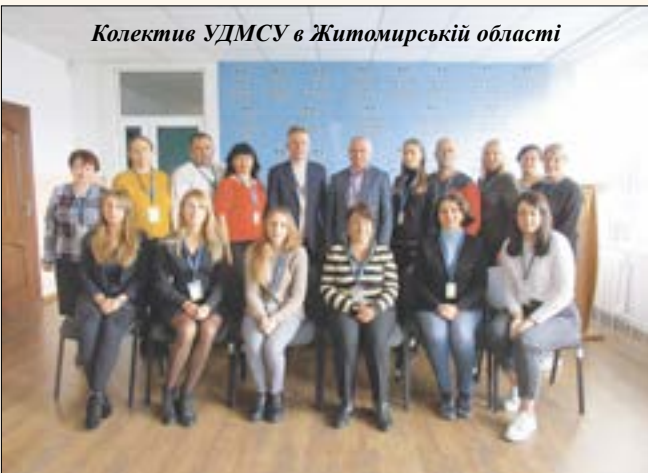
Колектив УДМСУ в Житомирській області

Одним з пріоритетних напрямків роботи міграційної служби є забезпечення максимальної зручності і доступності адміністративних послуг для громадян України, іноземців та осіб без громадянства, підвищення якості їх надання. 5 червня 2021 року відбулося офіційне відкриття першого