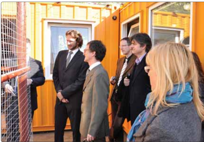
Відвідування представниками міжнародних організацій

Існують спроби й законного переміщення через кордон громадян Грузії на напрямку Поті (Грузія) – Іллічівськ (Іллічівська паромна переправа), але з подальшою організацією їх незаконного виїзду до країн Західної Європи, у тому числі через територію Молдови. Хоча деяка кількість громадян Грузії також намагаються незаконно працевлаштуватися на території України.