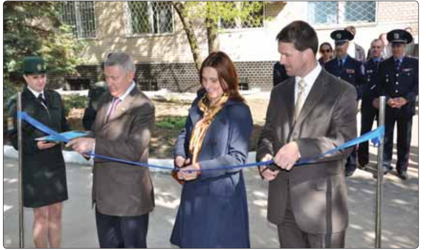
Відкриття спецприміщення в Одеському прикордонному загоні

Звичайно, така змістовна, копітка робота має свої результати. Прикладом, протягом 2010 року фахівцями Південного регіонального управління Держприкордон-