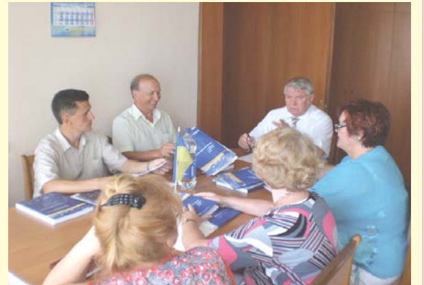
Обсуждение рабочего плана Одесским Региональным руководящим комитетом