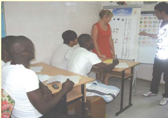
Занятия на курсах украинского/русского языков