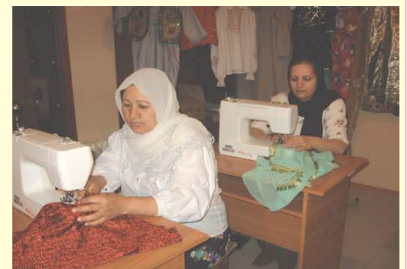
Учимся профессии швеи