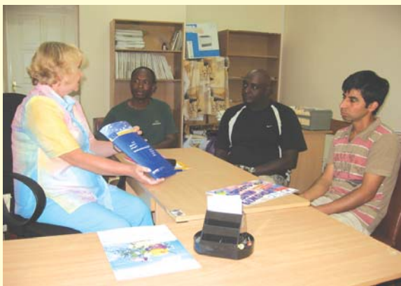
Групповое социальное консультирование по проекту