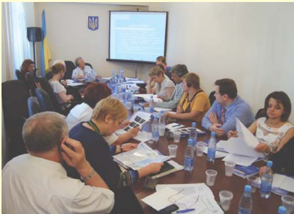
Заседание Национального руководящего комитета проекта

Местная интеграция – это интерактивный процесс, как со стороны беженцев, так и государственных структур и граждан Украины.