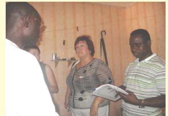
Социальное обследование и консультирование на дому