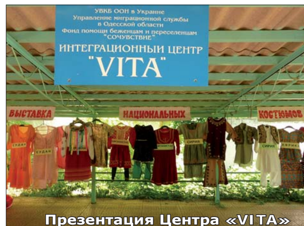
Презентация Центра «VITA»

- «Содружество африканских беженцев и иммигрантов (CAIRO),