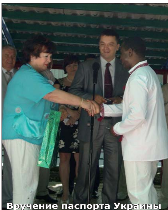
Вручение паспорта Украины