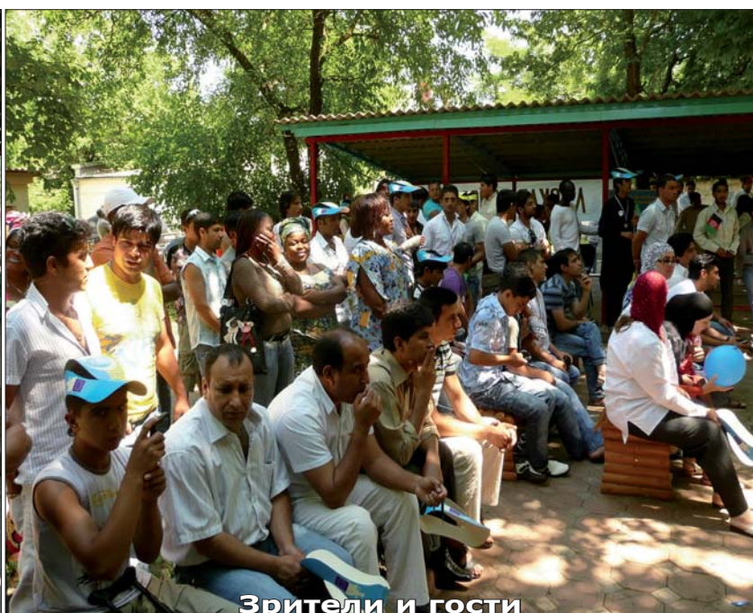
Зрители и гости