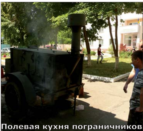
Полевая кухня пограничников