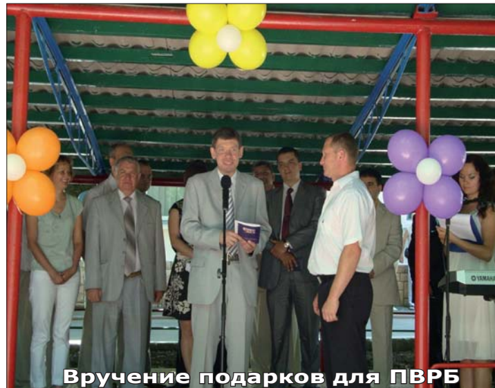
Вручение подарков для ПВРБ