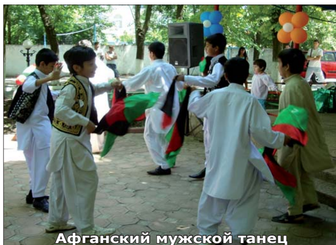
Афганский мужской танец