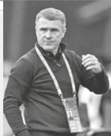
УКРАЇНА. ПРЕМ'ЄР-ЛІГА, 2024 - 2025

Українські вболівальники сподіваються, що команда зможе показати свій найкращий футбол і досягти омріяного підвищення.