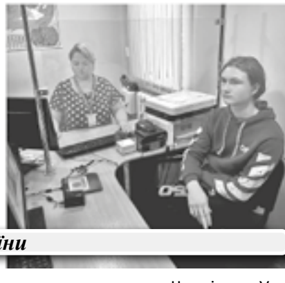
Документування громадян України

лося до міграційників із заявою про оформлення закордонних паспортів.