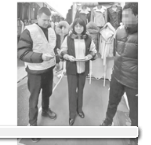
Протидія нерегульованій міграції