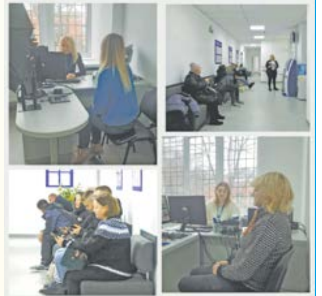
Управління ДМС у Хмельницькій області