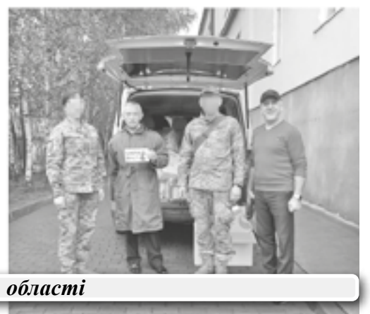
Благодійні проекти УДМС у Чернівецькій області