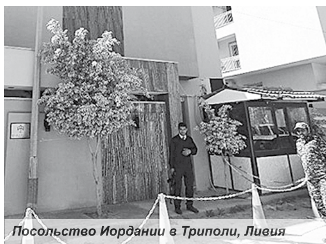
Посольство Иордании в Триполи, Ливия

Министерство иностранных дел Иордании уже подтвердило информацию о похищении.