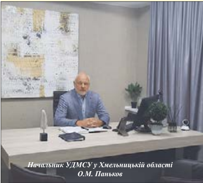
Начальник УДМСУ у Хмельницькій області О.М. Паньков

Управління ДМС України в Хмельницькій області – колектив професійних та досвідчених державних службовців, які щодня сумлінно виконують свої службові обов'язки, приймаючи виклики сьогодення.