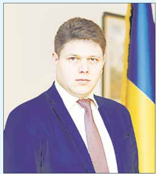
Голова Державної міграційної служби України Максим Юрійович Соколок

Зроблено важливий крок на шляху до децентралізації влади – відтепер органи місцевого самоврядування самостійно реєструють осіб за місцем проживання. Проведено значну роботу щодо інвентаризації всіх карток реєстрації особи та адресних карток та передано їх до органів, що здійснюють реєстрацію, а також доведено зазначену інформацію до відома громадськості, надано практичну, консультативну та методологічну допомогу працівникам відповідних органів реєстрації. Ознакою того, що роботу проведено на совість є те, що жодна з облдержадміністрацій не повідомила про неготовність виконувати з 4 квітня 2016 року повноваження у сфері реєстрації, делеговані ДМС.